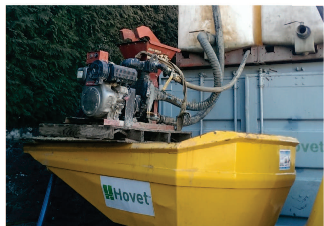
Serbatoio per le iniezioni di Bentonite